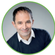
Benoît Hamon Président, ESS France , chambre représentative de l'économie sociale et solidaire Directeur Général, ONG SINGA

Les crises se succèdent, qu'elles soient énergétiques, économiques, géopolitiques, et la tentation d'ignorer la crise climatique se fait sentir. Comment garder le cap dans un monde en tension ?