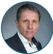
Fabrice Bonnifet Président Collège des Directeurs du développement durable (C3D) et de GenAct

En 2025 les entreprises ont un sens, une mission et sortent de plus en plus des modèles traditionnels. Reste que choisir le bon schéma n'est pas simple pour celui qui veut penser sa société autrement. Explorons ensemble la jungle des nouvelles structures d'entreprises, sans filtres et sans a priori.