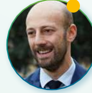
Stanislas Guerini Délégué Général LREM