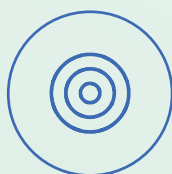
Formulation de l'ambition