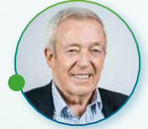
Jean-Louis Bal Président Syndicat des Energies Renouvelables