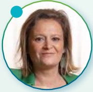
Olivia Grégoire Secrétaire d'Etat, Économie sociale, solidaire et responsable Ministère de l'Economie, des Finances et de la Relance

10 MARS 2022 - PAVILLON D'ARMENONVILLE, PARIS