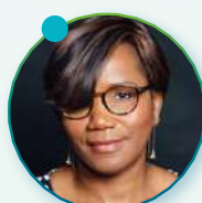
Elisabeth Moreno Ministre déléguée auprès du Premier ministre, Ministère de l'Égalité entre les femmes et les hommes, de la Diversité et de l'Égalité des chances