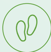
Réduction de l'empreinte