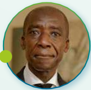
Alain Tchibozo Chief Economist Banque Ouest Africaine de Développement (BOAD)