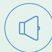
Transparence et communication